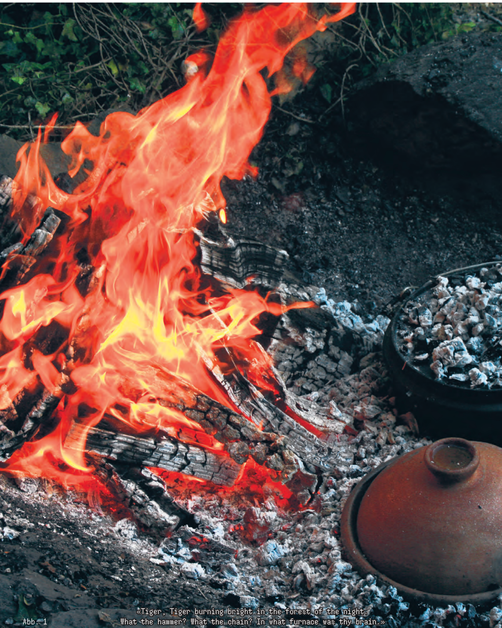
«Tiger, Tiger burning bright in the forest of the night. What the hammer? What the chain? In what furnace was thy brain.»